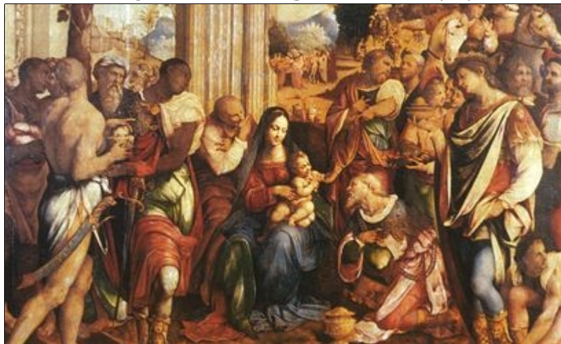
Adorazione dei Magi (particolare), di Cesare De Sesto (1477-1523), olio su tavola, Napoli, Museo Nazionale di Capodimonte.

Attorno alle figure dei Re Magi , sin dai tempi più lontani, si sono diffuse storie e leggende.