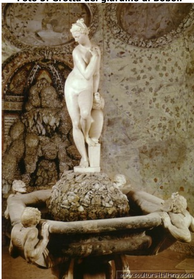
Statua di Venere del Giambologna, datata 1575.