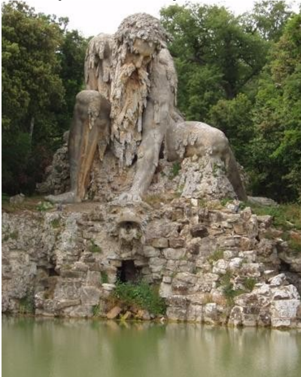
La statua dell'Appennino del Giambologna nel parco di Pratolino